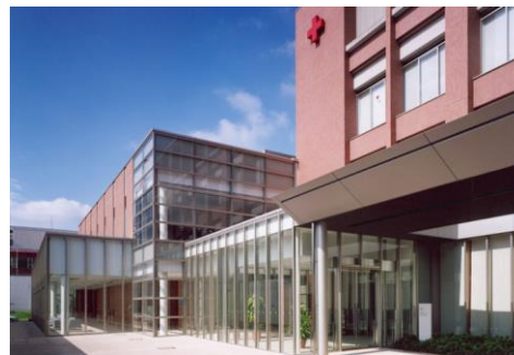
日本赤十字看護大学広尾キャンパス