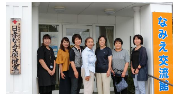
日赤なみえ保健室