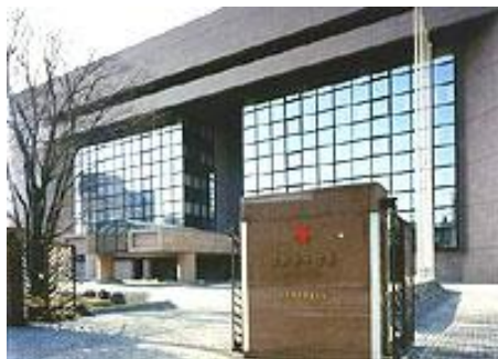
日本赤十字社本社